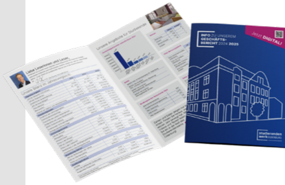
Der digitale Geschäftsbericht bietet viele Möglichkeiten im Content – der Begleitflyer bringt die Stakeholder auf die Website.