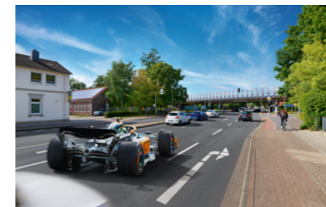
Links: ein KI-generiertes Kampagnen-Layout. Rechts: das finale Werbemotiv – eine Bildcollage aus zwei echten Fotos