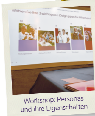
Die Zielgruppe wird unter die Lupe genommen.